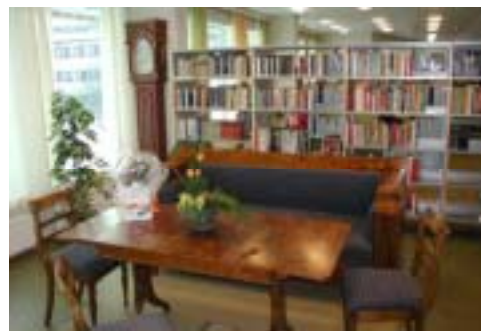
Sittegruppe i Østre Toten folkebibliotek

Denne modellen vektlegger at det er få åpne sosiale møteplasser igjen i samfunnet. De fleste er kommersialiserte arenaer. Bibliotekene får dermed en rolle som en møteplass hvor den enkelte kan utforme "sitt" bibliotek og gjøre seg nytte av de tilbud som ønskes benyttet. I sammenheng med at barn og voksne i større grad enn før må ta ansvar for egen læring, blir bibliotekenes rolle som læringsarenaer betydelig. Knappt noen annen samfunnsinstitusjon har denne åpenheten. Utvikling av bibliotekene som den flerkulturelle møteplassen blir viktig og trenger spesielle tiltak.