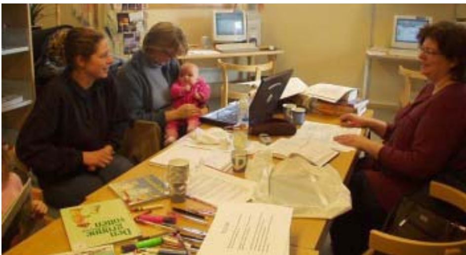
Sykepleierstudenter i biblioteket