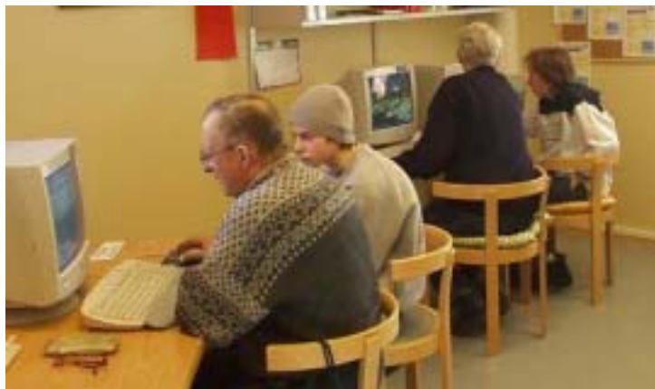
"Seniorsurf" ved Sør-Aurdal folkebibliotek

Også til offentlig sektor endres forventningene kontinuerlig og det stilles krav til omstilling og fornyelse. For at bibliotekene skal framstå som kunnskapsbedrifter i et konkurransesamfunn, blir det behov for kontinuerlig oppdatering av bibliotekansatte. Fylkesbiblioteket bør arbeide for å øke mestringsgrad og kompetanse blant folkebibliotekansatte i fylket, blant annet ved kurs og konferanser.