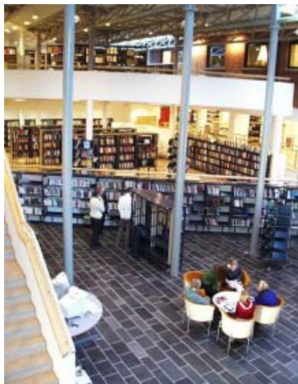
Fra Lillehammer bibliotek

Kravene til fornyelse i offentlig sektor gjelder også bibliotekene. Biblioteksektoren må defineres inn i en større sammenheng der informasjons-, kunnskaps- og kulturutvikling diskuteres. Planen bør også definere behovet for fylkesbiblioteket som en regional aktør og si noe om hvilken rolle det regionale nivået bør spille som en koordinerende faktor i utviklingen av et framtidsrettet bibliotekvesen i Oppland.