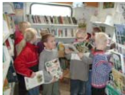
Aktive bokbussbrukere

Bokbussbibliotekaren har en aktiv formidlerrolle og i 2002 ble det gjennomført 109 bokprater. En mobil bibliotekteneste som retter seg direkte til barn er et verdifullt supplement til folke- og skolebibliotekene. Den har et godt og aktuelt bokutvalg og oppsøker barn i deres eget skolemiljø. Bokbussen har en viktig rolle i lesestimuleringssammenheng.