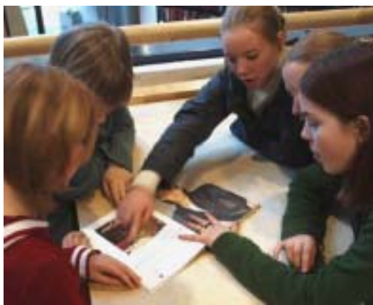
Engasjert ungdom i biblioteket